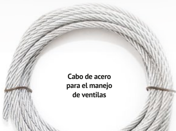
Cabo de acero para el manejo de ventilas