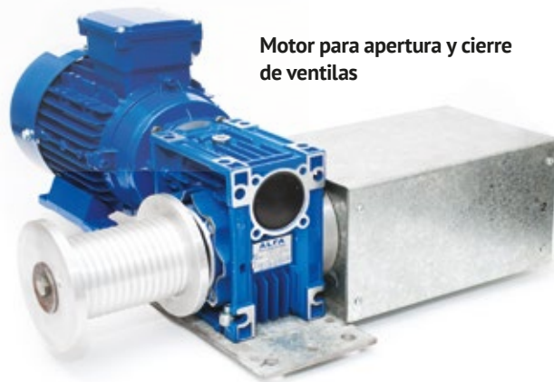
Motor para apertura y cierre de ventilas